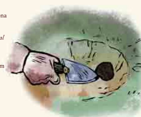
(Extracción de la trufa) ^

Ayuntamiento de Zarzosa Plaza Mayor, 1 Tel. 941 742 001