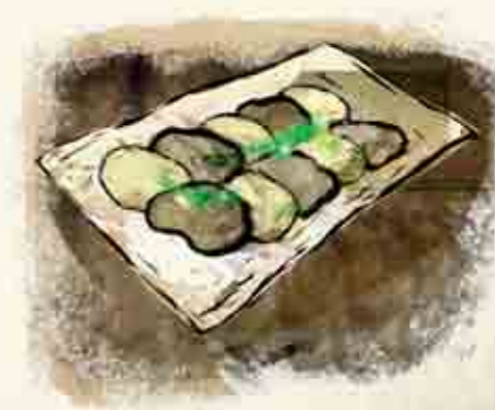
(Carpaccio de patata y trufa) ^

Casa Rural Victoria Cantón, s/n Tel. 941 197 018