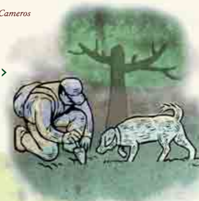
(Búsqueda de trufa con perro) >

Casa Rural el Hornal C/ San Juan, 4 Telf. 941 464 120