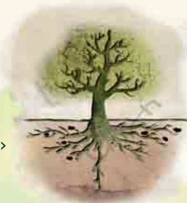
(Árbol con trufas) >

Viveros Veplam Ctra. de Laguna, s/n LR-250 PK 27 Soto en Cameros Telf. 637 201 041